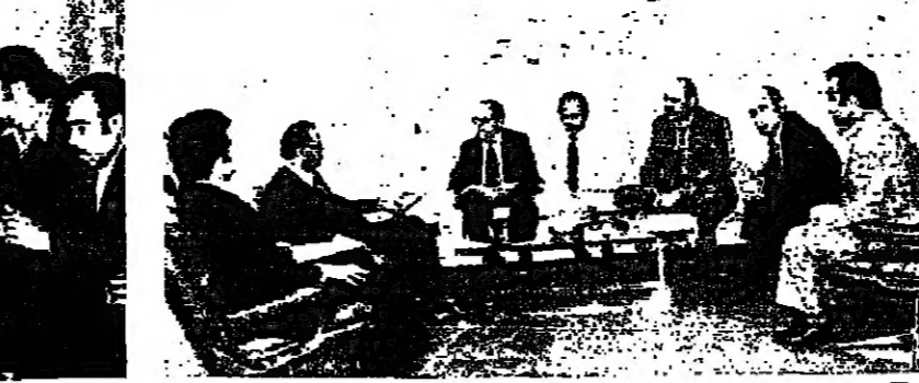
الحص يستقبل وفد نقابات اطباء والمهنيين